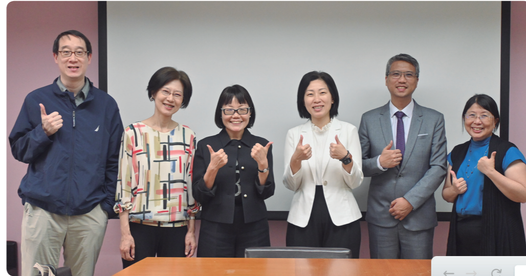
撰文＝李晏儀

速發展下所面臨的轉變與挑戰。座談會藉由實務經驗的分享，帶領法學院師生思考AI時代下法律實務與法學教育的發展方向，期望協助學生在進入職場前，做好專業能力與包容心態的準備。