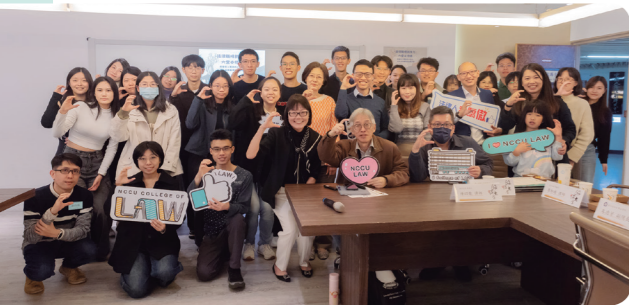
撰文＝李元熙、沈子晴