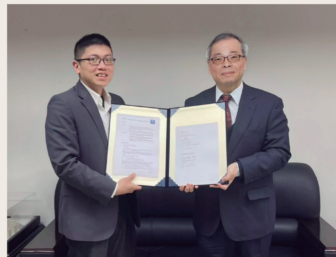
正式簽署完畢合影

「雙聯學位學程協議」的簽署象徵著雙方在法學領域的深化合作，並為學生帶來更多元化的學習體驗。依本協議規定，透過此合作管道薦送出國修習雙聯學位的同學，可享墨爾本大學10%的學費優惠，且參與雙聯學位學程的學生將有機會在兩校之間進行學術交流，並最終獲得墨爾本大學頒發的法學碩士學位。在全球化的趨勢下，這項合作將有助於提升學生的國際視野與職場競爭力，同時推動兩校在教學、研究及資源共享方面的互惠交流，本院已有同學預備前往。